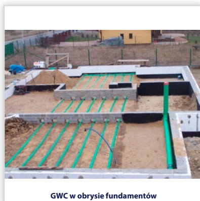
GWC w obrębie fundamentów