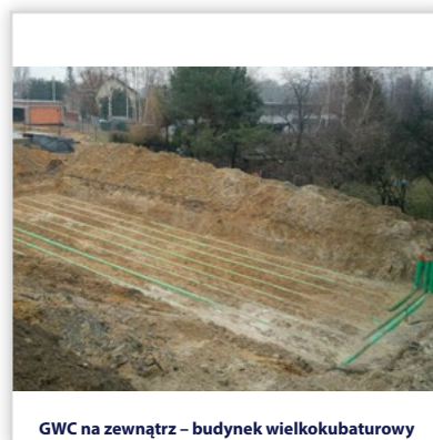
GWC na zewnątrz – budynek wielkokubaturowy