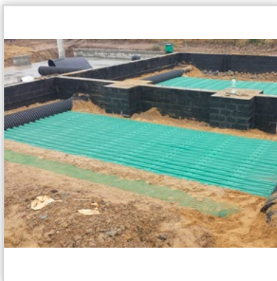
Gruntowy wymiennik ciepła GEOSTRONG – w fundamentach