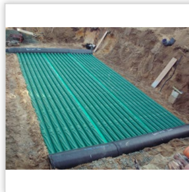
Gruntowy wymiennik ciepła GEOSTRONG – na zewnątrz domu