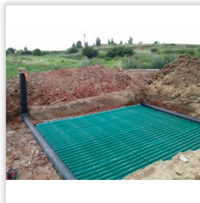
Gruntowy wymiennik ciepła GEOSTRONG – na zewnątrz domu. GWC bezprzeponowy modułowy. Przepływ powietrza turbulenty, wymiana cieplna ze wszystkich stron GWC. Wytrzymałość na nacisk z góry: 460 t/m 2 . Zastosowanie: w wentylacji mechanicznej we współpracy z rekuperatorem w domach jednorodzinnych, wielorodzinnych. Możliwość wykonania GWC o każdej wielkości przepływu powietrza. Możliwość samodzielnego montażu.