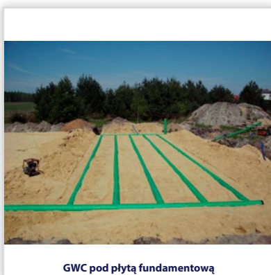
GWC pod płytą fundamentową